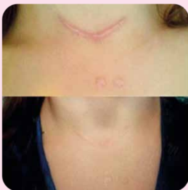
После 3 курсов микротоковой терапии с гелем Ферменкол