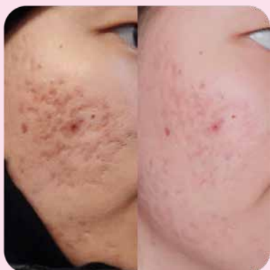
После 1 курса аппликаций с набором Ферменкол Элактин