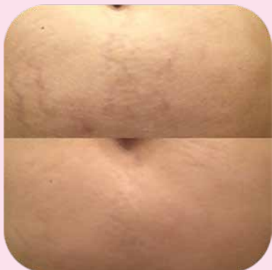
После 2 курсов аппликаций с набором Ферменкол Элактин