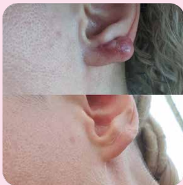
После 2 курсов аппликаций с гелем Ферменкол