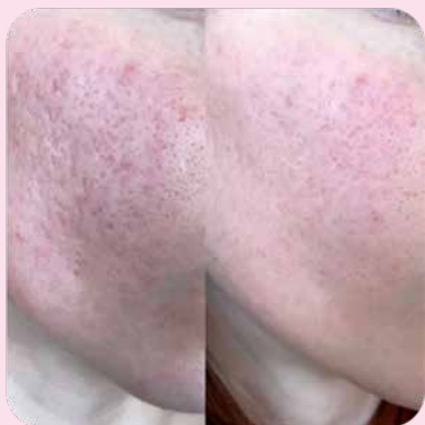
После 1 курса фонофореза с набором Ферменкол Элактин

В результате применения Ферменкол наблюдается полное или частичное регрессирование рубцов, происходит уменьшение их глубины, стирается разница в цвете между рубцовой и окружающими тканями, обесцвечивается интенсивная ярко-фиолетовая окраска, поднимается дно рубцов. 1