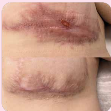
Гипертрофический рубец после маммопластики

Фотодинамическая терапия на аппарате Revixan 1 раз в неделю, Ферменкол гель 2 раза в день