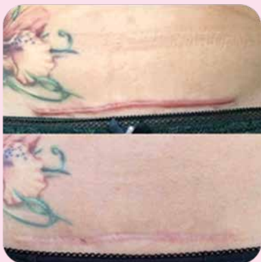
После 3 курсов микротоковой терапии с гелем Ферменкол