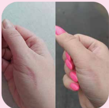
После 1 курса аппликаций с набором Ферменкол Элактин