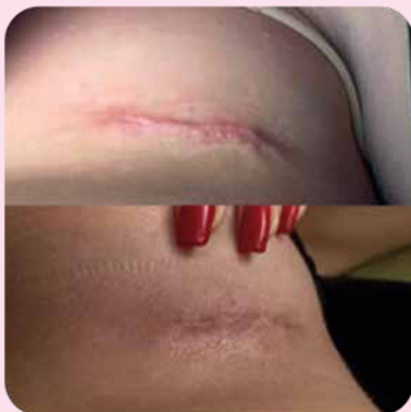
После 2 курсов аппликаций с гелем Ферменкол