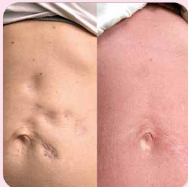
Осложнение после введения полимолочной кислоты Курс с гелями Ферменкол S и Элактин после инъекций дексаметазона и лазеродеструкции сосудов