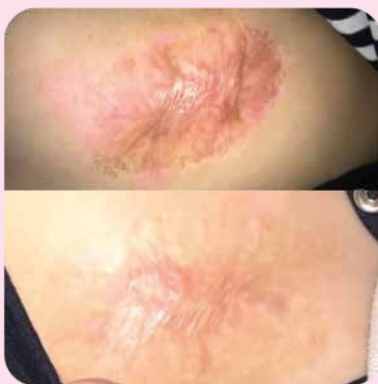
После 1 курса электрофореза с набором Ферменкол