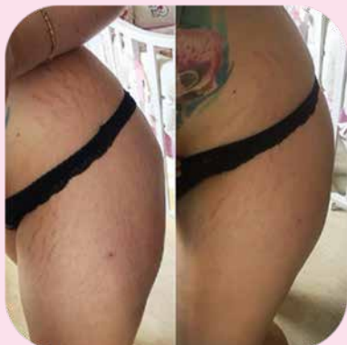
После 1 курса аппликаций с набором Ферменкол Элактин