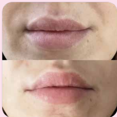
Гиперкоррекция филлером гиалуроновой кислоты 5 процедур микроотоковой терапии с гелем Ферменкол

*Количество курсов и методы применения смотрите в разделе «Методики применения»