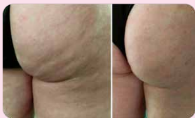
Фиброзный целлюлит 4 процедуры микронидлинга с раствором Ферменкол с интервалом 2 недели

Фонофорез с гелем Ферменкол и микронидлинг с набором Ферменкол для энзимной коррекции — эффективные методы борьбы с фиброзным целлюлитом. Данные методы позволяют коллагенолитическим ферментам проникнуть в соединительную ткань и расчистить внеклеточный матрикс от деформированных волокон патологического коллагена. Ферменкол обеспечивает мощный гидролиз измененного коллагена, в результате чего эффективно разрыхляются фиброзные микроузлы и макро модули, значительно выравнивается рельеф и повышается тургор кожи*.