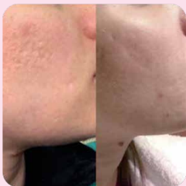
После 1 курса электрофореза с набором Ферменкол Элактин