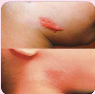
После 2 курсов электрофореза с набором Ферменкол