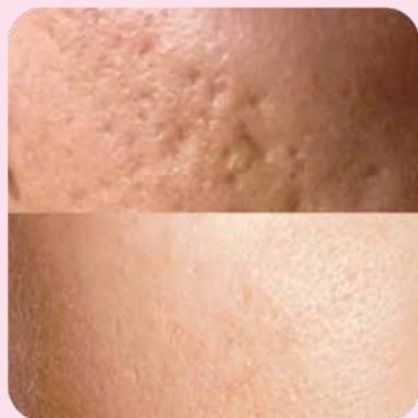
После 3 курсов аппликаций с гелем Ферменкол