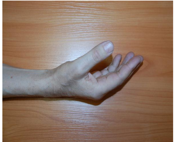
Рис. 1. Вид кисти до фонофореза Ферменкола ®