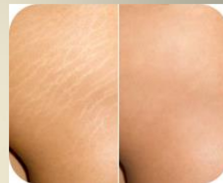
Старые стрии Фонофорез 3 курса Аппликации между курсами