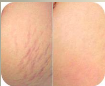
Молодые стрии Аппликации 30 дней