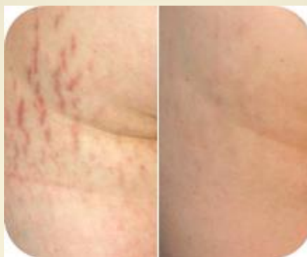
Молодые стрии Аппликации 60 дней